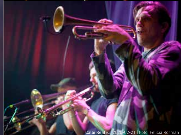
Calle Real (SE) 2020-02-21