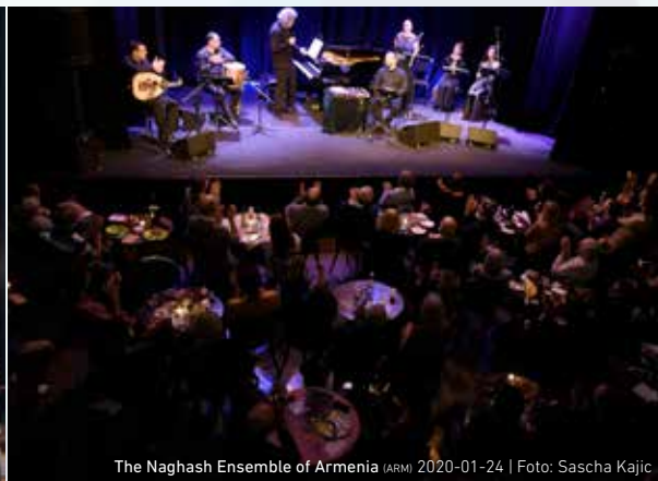
The Naghash Ensemble of Armenia (ARM) 2020-01-24

Föreningen hyr idag lokalen på Södra Förstadsgatan 18. 2014 skrev föreningen ett nytt upplåtelseavtal med Kulturförvaltningen. Huset ägs av Stadsfastigheter. Lokalen har tillstånd att ta in 300 personer (170 sittande). För att hålla nere administrativa kostnader har föreningen idag inget hyreskontrakt för kontor.