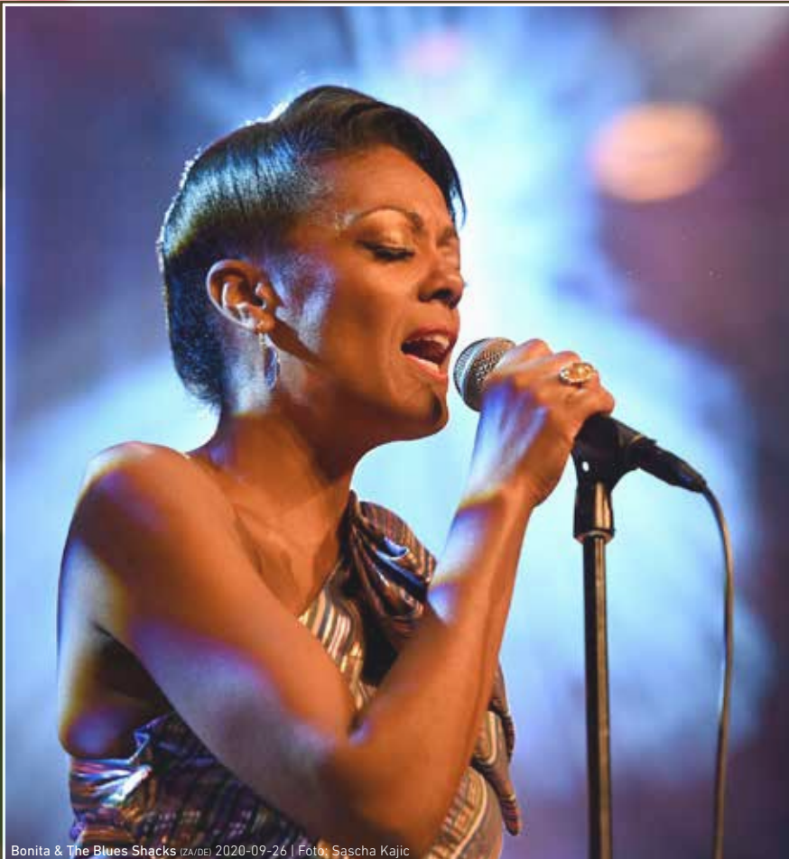
Bonita & The Blues Shacks (ZA/DE) 2020-09-26