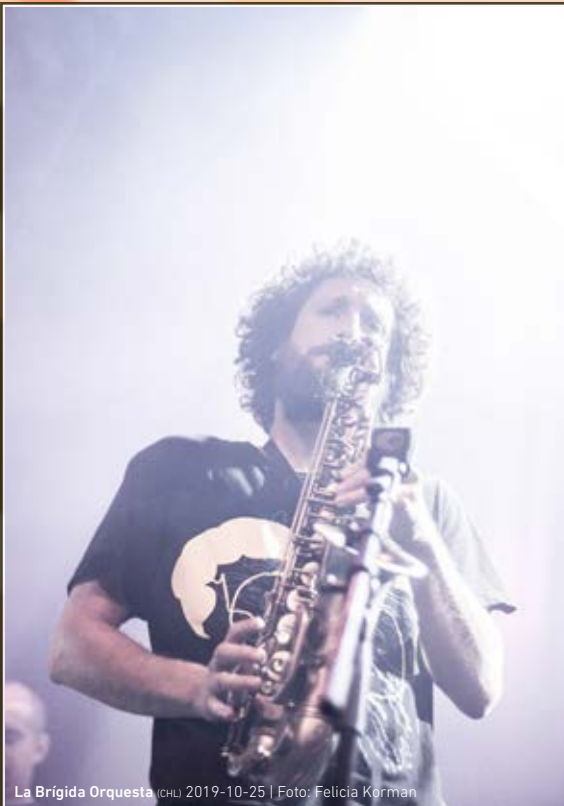
La Brígida Orquesta (CHL) 2019-10-25