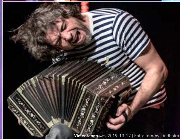
Violentango (ARG) 2019-10-17