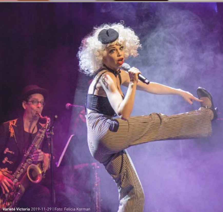
Varieté Victoria 2019-11-29