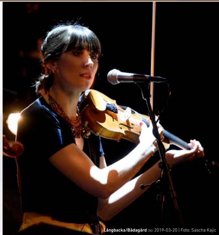
Långbacka/Bådagård (SE) 2019-03-20

Vi eftersträvar också att ha en bra arbetsmiljö och att vara en bra arbetsgivare för våra anställda och artister -na vi engagerar. Det anser vi oss nu ha möjlighet till och vi kommer att arbeta aktivt för att göra Victoriateatern ännu mer attraktiv på den inhemska såväl som den internationella marknaden.