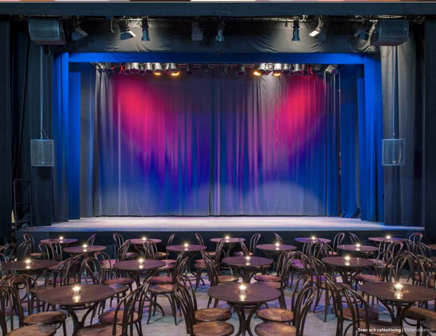
Scen och kafésittning | Victoriateatern